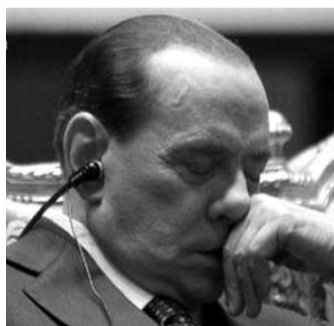
Il capo pensa...silenzio

Individualismo portato all'esasperazione, rozzezza, mancanza totale di rispetto per il prossimo e faciloneria. Qualche uomo politico potrebbe riconoscersi nel ritratto proposto nelle sale cinematografiche da Antonio Albanese che con il suo Cetto La Qualunque piace agli italiani. Lui è qualunquemente carismatico, qualunquemente evasore, qualunquemente furbetto... insomma qualunquemente italiano. Un fumettone tragicomico, grottesco, in cui gli italiani si specchiano perché Cetto ne riflette pregi e ne esalta difetti, ma soprattutto perché lui fa ed ha tutto ciò che vuole: nel caso specifico potere e pilu. Il film, preceduto dall'efficace spinta mediatica degli eventi attuali e da manifesti e gazebo piazzati in diverse città, è rimasto in cantiere per quasi due anni. Cetto La Qualunque, personaggio già conosciuto dal pubblico per le apparizioni a "Che tempo che fa" è un politico corrotto, maleducato, sprezzante e grottesco esaltato dal talento