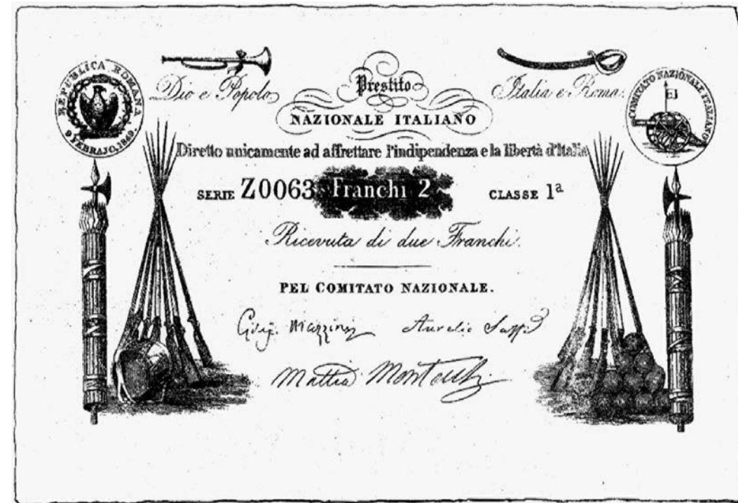
Da antico documento: ricevuta prestito di 2 Franchi

Come consuetudine in molte città repubblicane e i mazziniani si ritrovano per ricordare la proclamazione della Repubblica Romana del 1849. Ad Ancona il programma prevede vari momenti celebrativi: 9 febbraio ore 11 - Piazza del Plebiscito: deposizione della corona d'edera alla lapide di Mazzini. 11 febbraio ore 17,30 - Ridotto del Teatro delle Muse; Letture sulla Repubblica Romana - ore 20,30 Trattoria "da Gino" tradizionale cena.