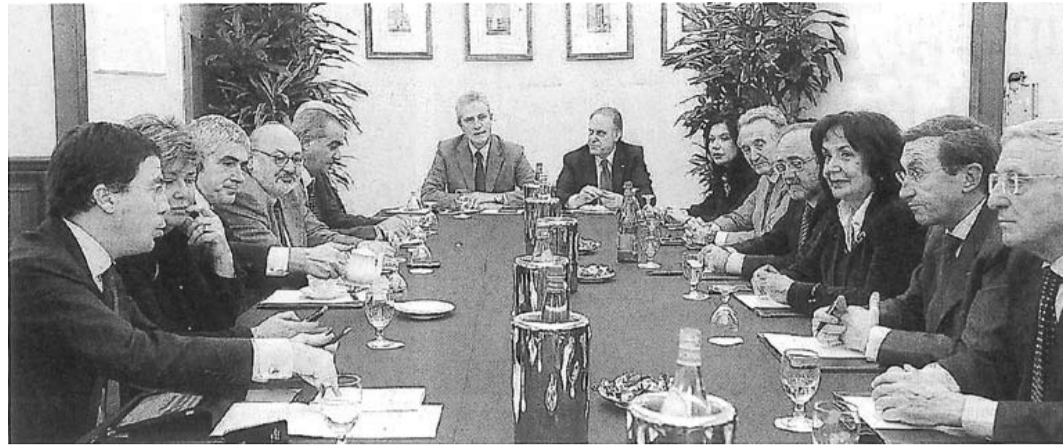
Roma: riunione dei partecipanti alla costituzione del terzo polo. Buon viaggio!

universitario e il sistema produttivo per ridurre il gap in essere nel campo dei brevetti tra l'Italia e i paesi più industrializzati; 7) l'assunzione della questione meridionale come esigenza nazionale, senza la quale il Paese non potrà mai raggiungere livelli efficaci di sviluppo; 8) un congruo impegno politico e finanziario nei confronti dell'università, della scuola, della formazione e della qualificazione professionale, intesi come strumenti essenziali per il sistema paese; 9) il conseguimento del governo politico federale europeo, come emanazione diretta degli elettorati nazionali. Nel decidere il sistema di alleanze per le elezioni amministrative della primavera prossima i segretari del PRI e dell'MRE hanno concordato di privilegiare la politica dei contenuti rispetto agli schieramenti. In vista del congresso che dovrà sancire la riunificazione e dar vita a una nuova sintesi politica, l'on. Nucara e la sen. Sbarbati hanno convenuto di mantenere inalterata la propria rispettiva collocazione politico-parlamentare.