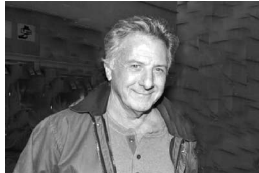
Dustin Hoffman, costoso testimonial della Regione Marche

appunto i lavoratori non venissero messi né in cassa integrazione né licenziati. I contributi a sostegno delle famiglie in difficoltà sono stati spalmati in vari settori. Ognuno ha cercato nel settore di propria competenza di modificare la legge in modo da poter poi intervenire. Inoltre ci sono interventi a favore delle cooperative, non solo dal punto di vista finanziario ma anche dal punto di vista legislativo. Come pure interventi per la ricerca e l'innovazione tecnologica. Anche se purtroppo proprio le aziende che si erano indebitate per interventi di ricerca e innovazione tecnologica poi per rimettersi sul mercato si sono trovate a subire gli effetti della crisi in