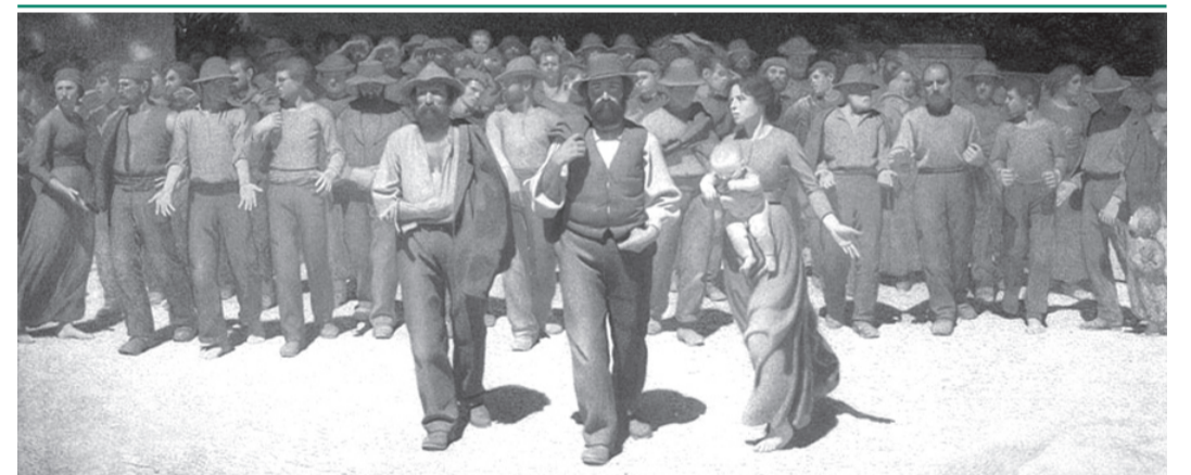
1 Maggio festa del lavoro e dei lavoratori. Festeggiamoli convintamente sono loro che si sacrificano per tutti e portano avanti l'economia del Paese