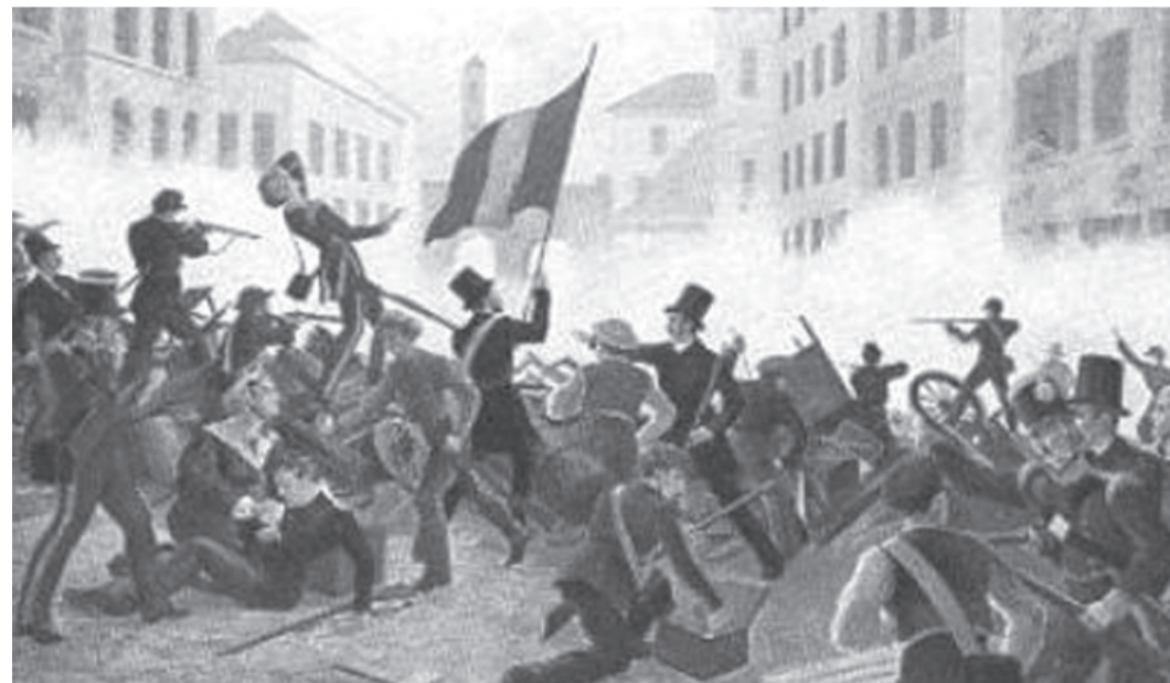
Le 5 giornate di Milano - Un ricordo che scalda il cuore, la città allora non aveva conosciuto le prepotenze delle caste dominanti

una guida sicura, capace di invertire un declino di cui essi sono causa e che pone l'Italia agli ultimi gradini della crescita e dell'occupazione tra le nazioni europee, ai primi in quello degli sprechi, dei privilegi e del malcostume politico. Era logico attendersi che il ventennio del berlusconismo e del bipolarismo all'italiana, condito dall'oppressione mediatica che ha sostituito i talk-shows al libero confronto politico e