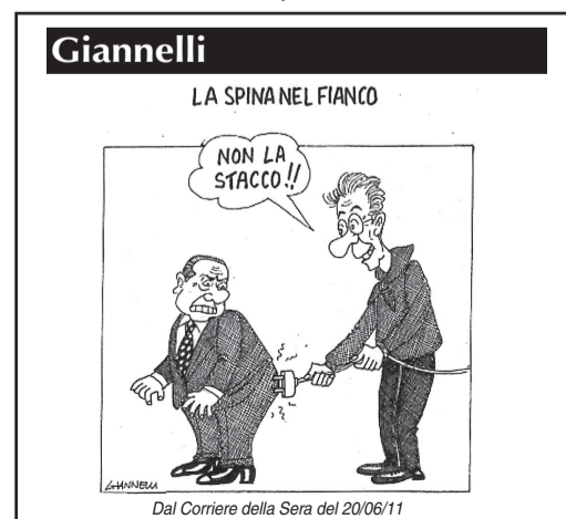
Quando il destino fa incontrare le anime buone

mondo tra società civile e società militare. Merita una riflessione l'azione intrapresa da Israele in merito alla ricerca dei geni tra gli studenti: lo stato sceglie, ogni 2 anni, 150/200 giovani. I più dotati, una volta scelti, studiano, inventano pacchetti di software per rendere più efficienti le loro FF.AA. e la società civile. Che progetti ha in atto il ns. Paese in ordine al tema in questione? Poco o nulla. L'iniziativa è libera e le risorse sono a carico della famiglia! Abbiamo università di pregio mondiale come i politecnici di Torino e Milano, le università con ricerca come Pavia o Pisa che potrebbero individuare i cervelli d'oro per creare uno staff di studenti-ricercatori da immettere sul mercato nazionale o cederli con contratti per un certo periodo a colossi mondiali. Gli istituti militari (Accademie per intendere) potrebbero accogliere questi giovani geni e dare loro strutture, logistica, disciplina con le borse di studio pubbliche o private per allevare codesti giovani per un certo lasso di tempo. Sarebbe un bell'investimento! Non vi pare?