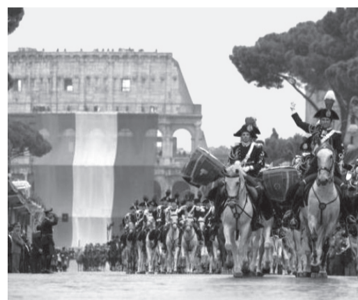
ROMA - 2 Giugno 2011 - La sfilata