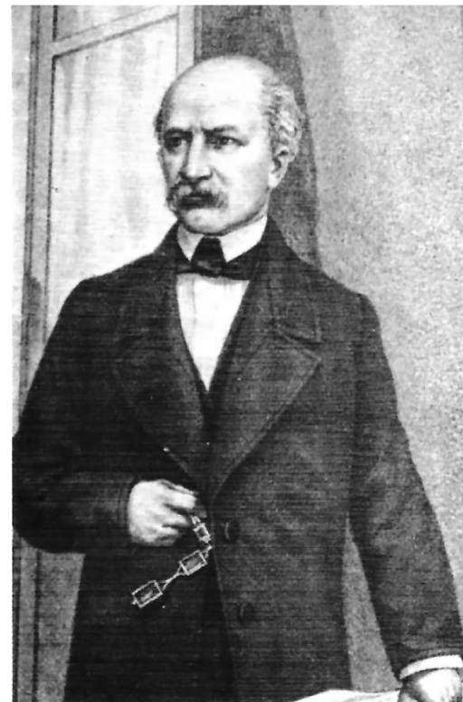
Carlo Cattaneo il teorico Repubblicano dell'autentico Federalismo

governavano contro i contadini, il popolo, favorendo la "borghesia" di allora - oggi li chiameremmo padroni -, latifondisti: togliere ai poveri per dare ai benestanti, che diventeranno speculatori, detentori di rendite improduttive, governeranno la politica (ancor oggi, non si muove foglia che