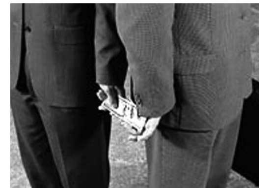
Corruzione: Il passaggio di denaro per corrompere

N el bel mezzo di una crisi economica colossale il nostro Paese si trova ad affrontare anche una crisi morale e politica. Siamo diventati gli "zimbelli" dell'Europa e del mondo intero; la moralità è diventato un aggettivo usato per condire i discorsi dei politici; soltanto di loro però, perché la gente comune, quella che fatica per far quadrare il bilancio familiare, lo ha cancellato dalla memoria. Tanto grave è la caduta della moralità che quando più persone conversano evitano, con un vorticoso giro di parole, di pronunciare la parola. Ruba la destra, anche per non perdere una naturale vocazione, la "casta" con tutti i suoi accoliti ha bisogno di concretizzare rapidamente l'accumulo perché storicamente ha sempre fatto così. I giovani