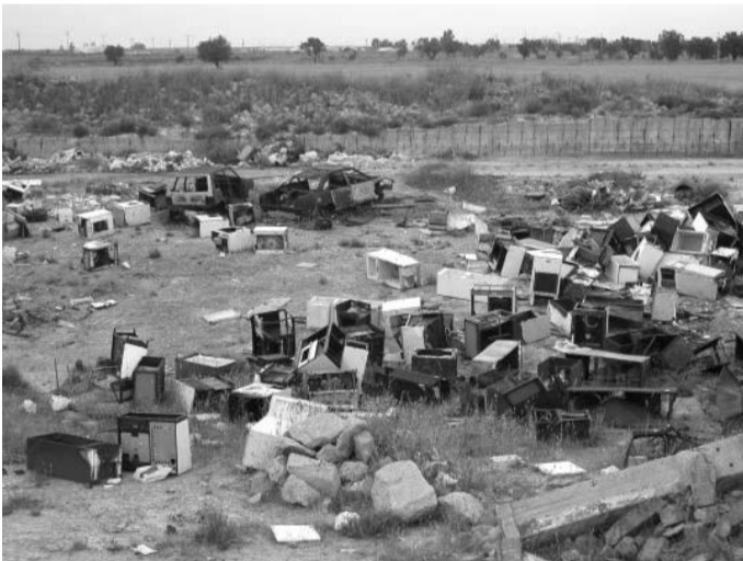
Problema dei problemi delle società sviluppate: la collocazione dei rifiuti

Era il 2007 quando il Governo Prodi con la Legge Finanziaria stanziò 5 milioni di euro per la realizzazione di un "sistema integrato per il controllo e la tracciabilità dei rifiuti" per combattere i traffici e gli smaltimenti illeciti. Nel 2009 il Ministro per l'Ambiente Prestigiacomo, preso atto dell'importante iniziativa, raccoglieva la sfida dei suoi predecessori puntando a eliminare il vecchio sistema cartaceo di gestione dei rifiuti e a introdurre il Sistri, per permettere l'informatizzazione dell'intera filiera dei rifiuti speciali a livello nazionale e dei rifiuti urbani per la Regione Campania. Il nuovo Sistema, che non è mai stato ben digerito dal mondo imprenditoriale per via delle novità e per le modalità degli adempimenti richiesti, avrebbe permesso, con il previsto supporto informatico, di individuare e verificare eventuali inosservanze, inadempimenti o