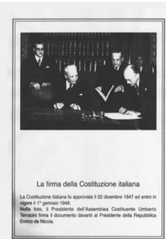
La firma della Costituzione italiana

dalla guerra, darsi un assetto governativo nuovo ed efficiente, ricostruire materialmente le città, le fabbriche, le strade, le ferrovie. Occorrevano tempi lunghi, buona volontà e capacità di attendere che tutta l'Italia fosse liberata: il 25 luglio 1945 era ancora lontano. Era necessario, soprattutto, riappacificare i cittadini tra loro: da una parte vi erano i partigiani, in Abruzzo e nel Nord Italia, e le brigate erano composte da simpatizzanti verso ideologie tra loro distinte, per radici intellettuali e scopi politici in proiezione futura, da perseguire, organizzando, appena possibile, i partiti politici di un'Italia nuova; i partigiani, dunque, pur nelle diverse convinzioni intellettuali e politiche, si battevano, rischiando ogni giorno la vita o le torture, per un solo ideale: liberare l'Italia dall'occupazione e dal dominio nazifascista, conquistando, per tutti i cittadini, le libertà politiche e civili e una vita democratica. Dall'altra vi erano i fascisti, quelli della prima ora e quelli giovanissimi della Repubblica Sociale; i loro ideali restavano quelli di sempre: governare l'Italia con un solo partito al potere, sotto la guida del dittatore, eliminando ogni partito politico ed ogni forma di vita intellettuale che non fosse rigorosamente fascista e legata solo alla Nazione italiana, disdegnando e proibendo nelle Scuole e nelle Università ogni contributo culturale di matrice straniera, in ogni disciplina. Dopo tanti